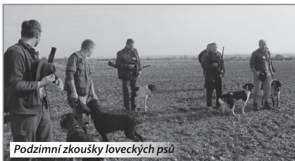
Podzimní zkoušky loveckých psů

V průběhu měsíce září, byli ve spolupráci s Honebním společenstvem Probluz vypuštěni bažanti královští. V průběhu listopadu a prosinci bude vypuštěn bažant obecný. Je potěšující, že již opět můžeme v polích a lesích naší honitby zahlédnout volnou populaci bažanta. Rovněž se již několik let snažíme oživit populaci králíka divokého a to zejména v bezprostředním okolí bažantnice.