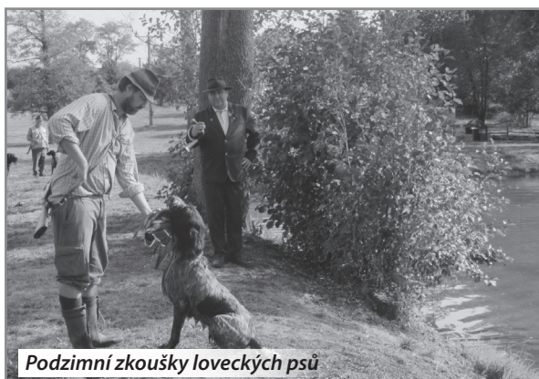
Podzimní zkoušky loveckých psů

V současné době myslivci z Probluze zajišťují akce, které překračují rámec honitby. V sobotu 1. 10. 2016 jsme společně s Okresním mysliveckým spolkem ČMMJ Hradec Králové, pořádali „Podzimní zkoušky loveckých psů“. Jsou to zkoušky, kterými musí úspěšně projít každý lovecký pes, aby jej bylo možné použít při lovecké činnosti. Dá říci, že je to maturitní zkouška pro kvalifikaci psů a zároveň vizitka každého vůdce