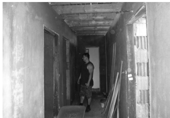
Hostinský na kontrole novostavby

Stavební práce byly zakončeny 30. 7. 2011 slavnostní kolaudací spojenou s opékáním prasátka. Na pohoštění se kromě naší obce finančně podílela i stavební firma JOKAS. Na příjemném posezení v obecním hostinci se tak sešli pracovníci, kteří stavbu prováděli i místní občané, kteří si přišli jejich dílo poprvé prohlédnout.